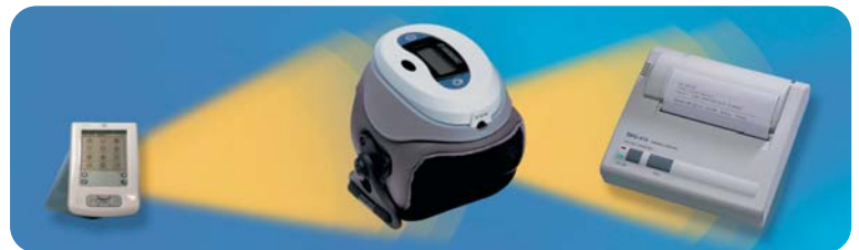
Intelligente Technologie bietet die Möglichkeit der komfortablen Ergebnisanalyse und Behandlungsüberwachung (gehört zum Service von Orthofix)

Kann über Gipsverband oder Kleidung getragen werden